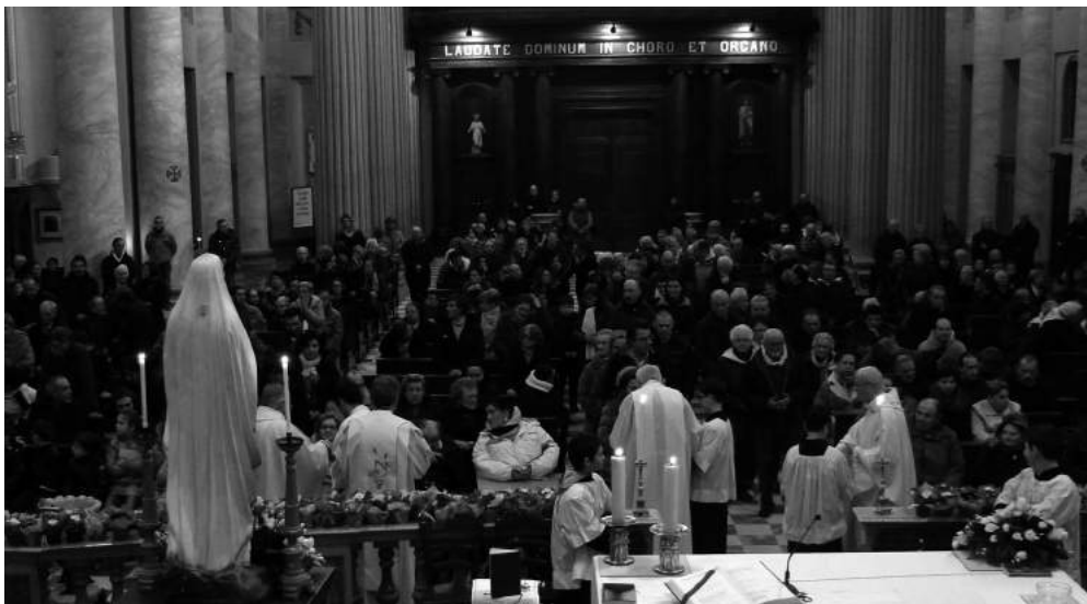
Nella foto, un momento della Celebrazione in San Paolo con il Vescovo durante l'amministrazione del Sacramento dell'Unzione dei malati